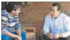
M. RUIZ / LA ENTREVISTA

➔ ¿Se parece en algo el periodismo deportivo de hoy al de cuando empezó?